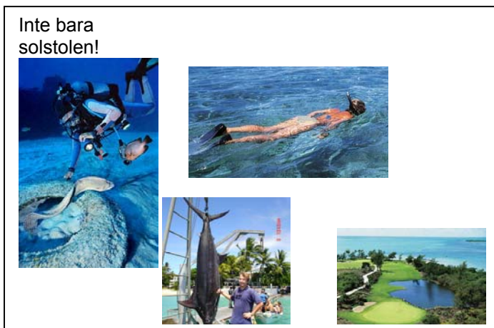
Inte bara solstolen!