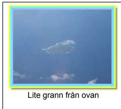
Lite grann från ovan