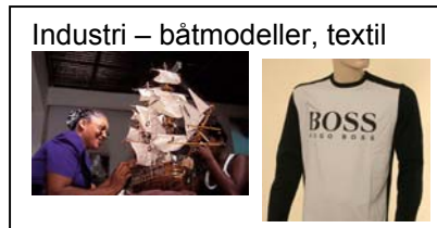
Industri – båtmodeller, textil