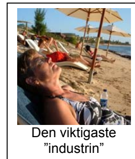
Den viktigaste "industrin"